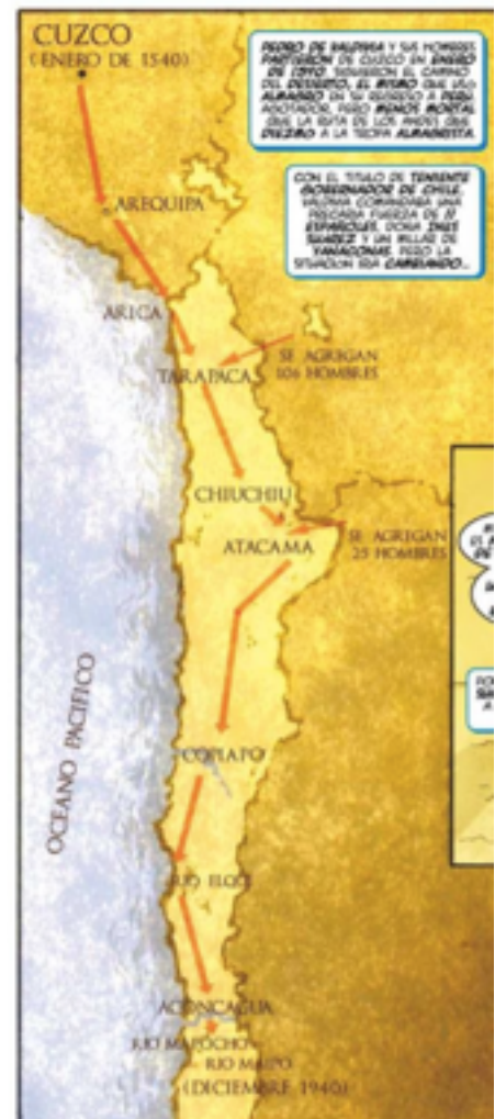
Ruta seguida por Pedro de Valdivia

Antes de ver el video, lee las preguntas de la próxima hoja, para que estés atento a esa información cuando aparezca en el video.