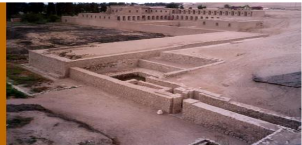
Pachacamac Isla de Sol, lago Titicaca

Los incas llamaban huaca a todas las cosas sagradas, entre ellas se encontraban los cerros y las montañas, algunos cuerpos celestes o fenómenos climáticos como rayos, relámpagos o truenos. En muchos lugares se erigieron templos en los lugares donde se encontraban las huaca .