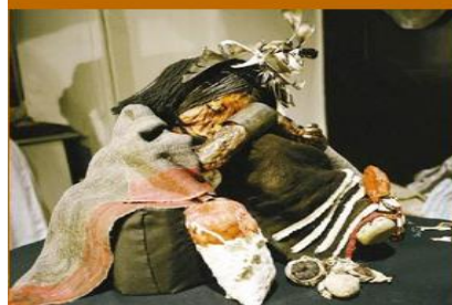
Niño momificado del cerro El Plomo, frente a Santiago